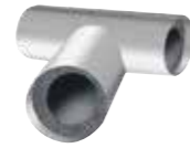
Vorgeformtes IC CLAD T-Stück silber