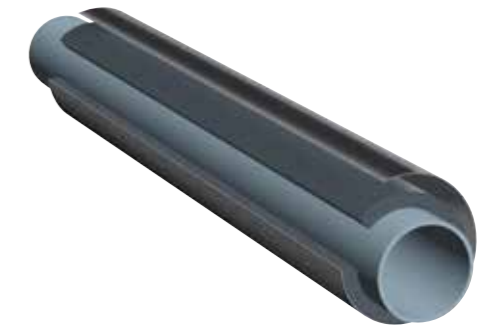
K-FLEX® IC CLAD SYSTEM SCHWARZ - Schläuche