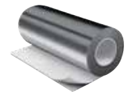
IC CLAD Beschichtung silber