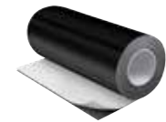
IC CLAD Beschichtung schwarz