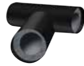
Vorgeformtes IC CLAD T-Stück schwarz