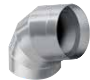
Vorgeformter IC CLAD Bogen silber