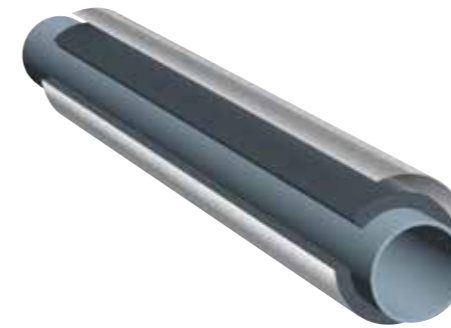
K-FLEX® IC CLAD SYSTEM SILBER - Schläuche