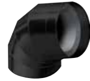
Vorgeformter IC CLAD Bogen schwarz