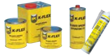
K-SIL Silikon, erhältlich im Zubehör Abschnitt Klebstoffe und Verdüner. Weiteres Zubehör siehe Rubriken Zubehör, Rohrträger und Tapes.