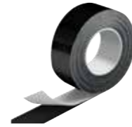
IC CLAD Tape / Klebeband schwarz