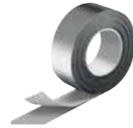
IC CLAD Tape / Klebeband silber