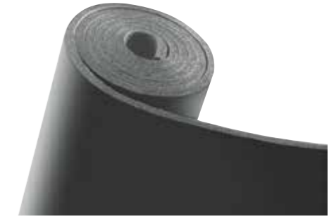
K-FLEX® IN CLAD SYSTEM SCHWARZ - Platten

Hinweis: Das K-FLEX® IN CLAD SYSTEM wird standardmäßig in der Ausstattung K-FLEX® ST produziert. Gegen Aufpreis ist das System auch in Kombination mit K-FLEX® ECO, K-FLEX® HT oder anderen K-FLEX® Elastomerprodukten lieferbar. Projektbezogene Sonderanfertigungen sind auf Anfrage möglich. Mindestbestellmengen, Verfügbarkeit und Liefertermin bitte immer mit dem Customer Service oder Ihrem Kundenberater abstimmen.