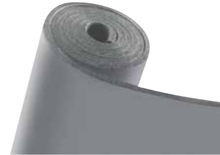
K-FLEX® IN CLAD SYSTEM GRAU - Platten