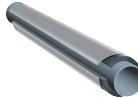
K-FLEX® IN CLAD SYSTEM GRAU - Schläuche