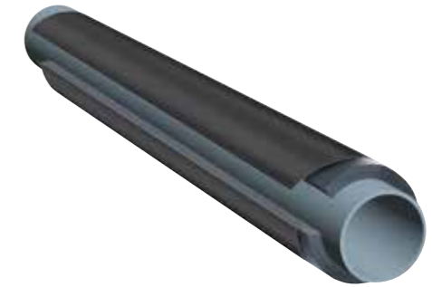
K-FLEX® IN CLAD SYSTEM SCHWARZ - Schläuche